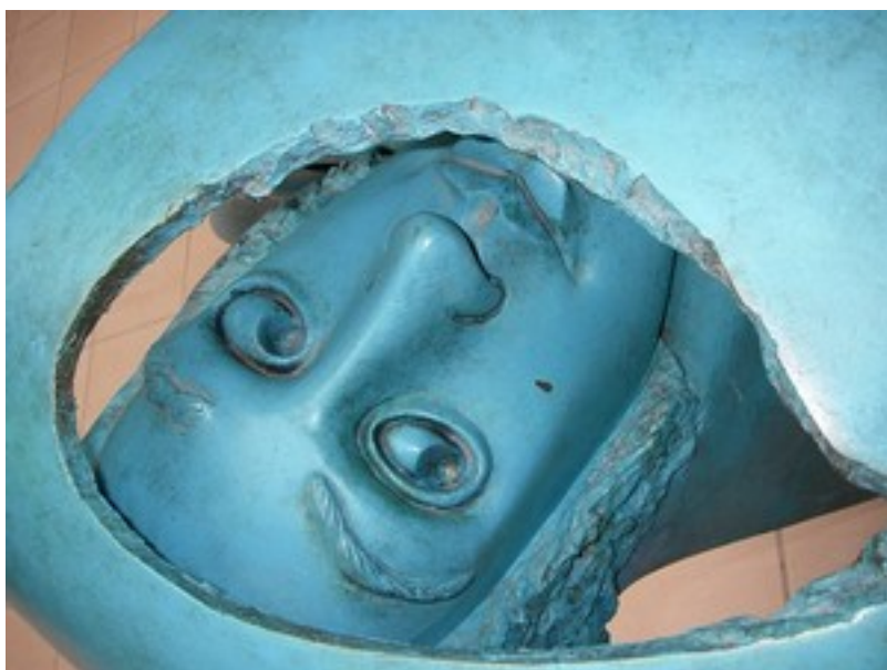
"Et é 94" (d détail)