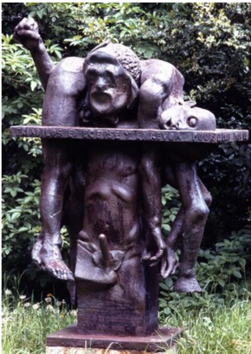
Mort du Fr ère