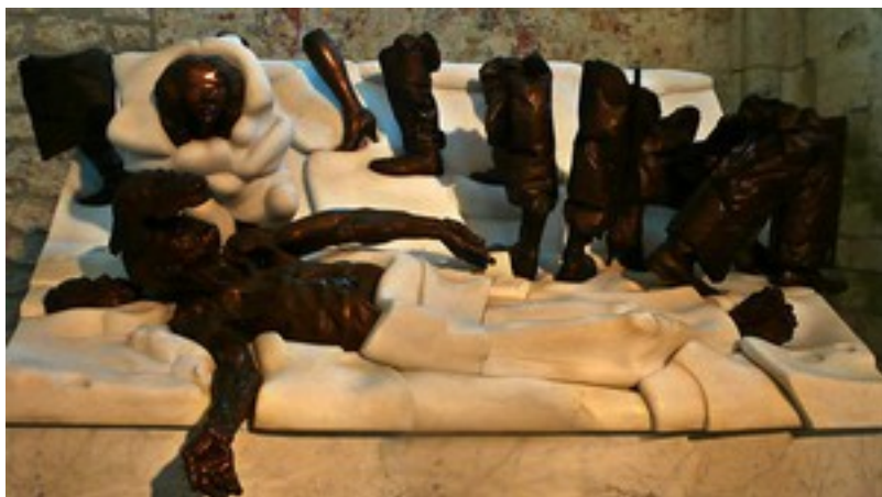
Eglise de Dun - Mort de l' évêque Neumann