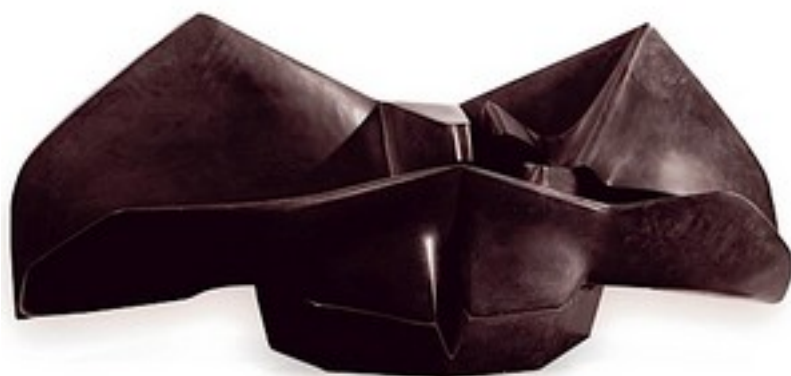
Crabe oiseau, 1958

A la même époque, il réalise Crabe oiseau, 1958, bronze à patine noire estimé 8 000-10 000 ₣, puis Saint-Jean d'Acre, 1960, bronze à patine brune, estimé 25-30 000 ₣.