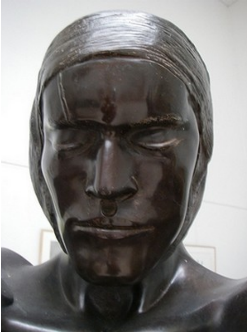
"Val de Gr âce" (d détail)