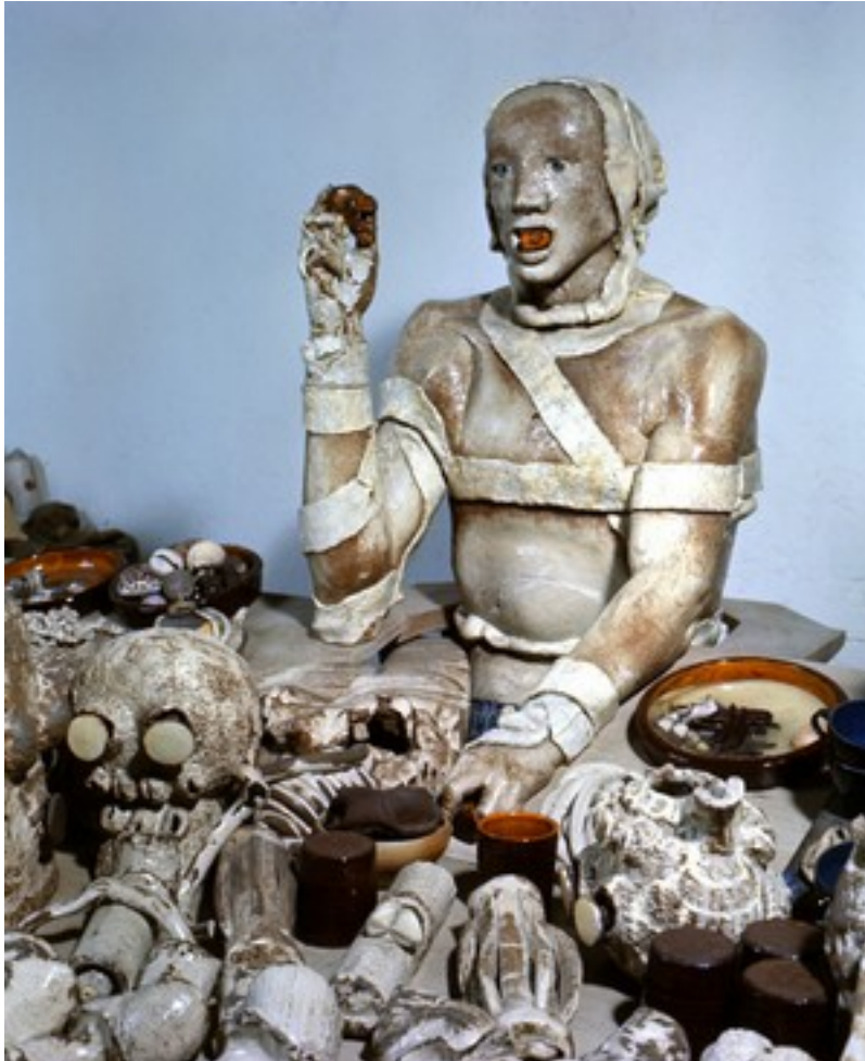
Mangeurs de Gardiens