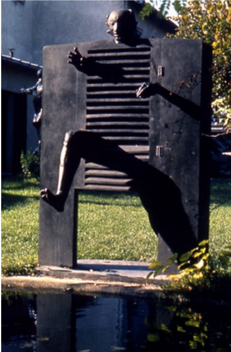
Homme poussant la Porte